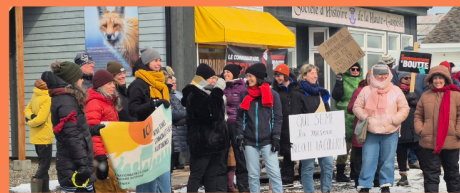
Gracieuseté de France Leblanc